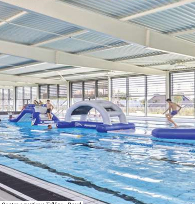
Centre aquatique Tri'Eau - Baud