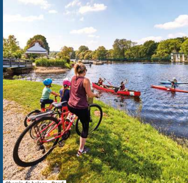
Chemin de halage - Baud