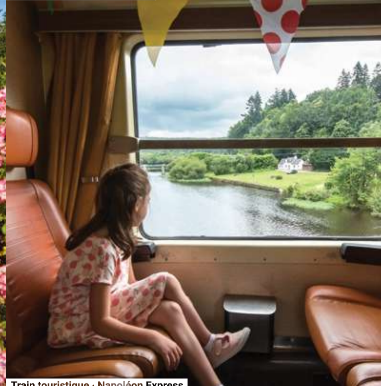
Train touristique - Napoléon Express