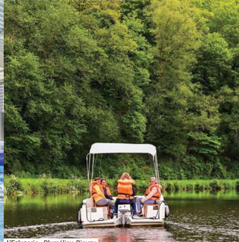
L'Écluserie - Pluméliau-Bieuzy