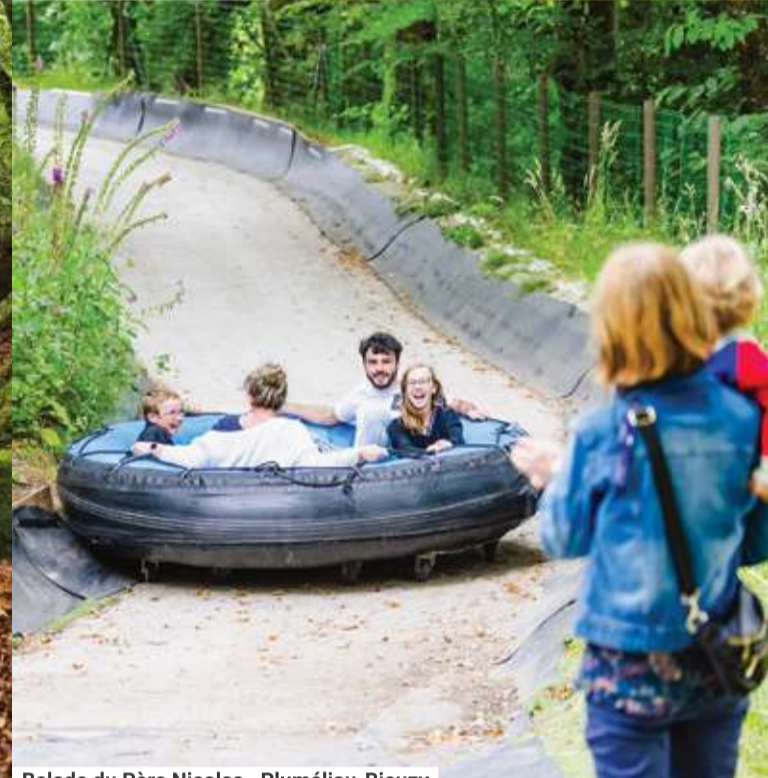
Balade du Père Nicolas - Pluméliau-Bieuzy