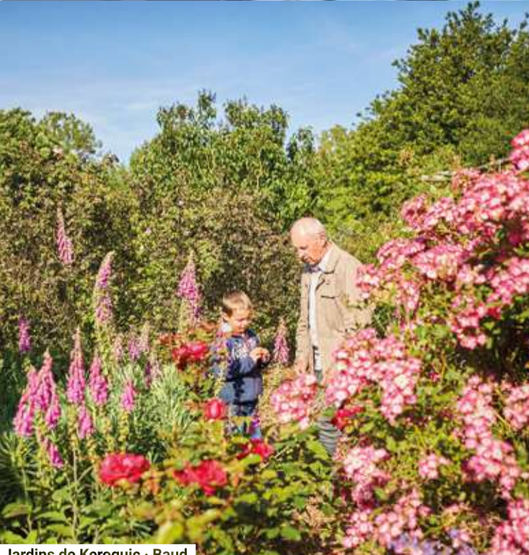
Jardins de Kerogic - Baud