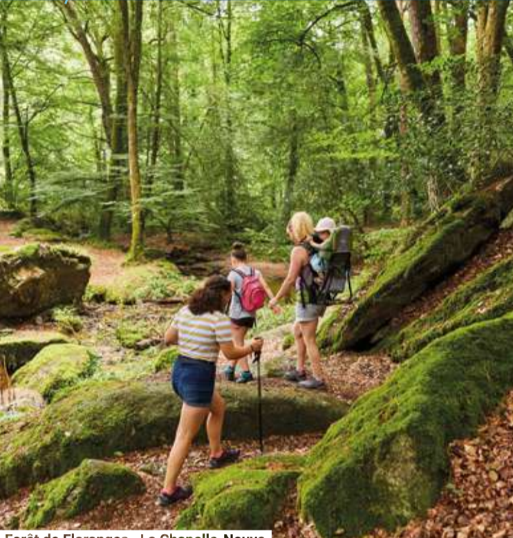
Forêt de Floranges - La Chapelle-Neuve