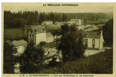
© Carte postale ancienne de Saint-Rivalain, Crédit Musée de la Carte Postale de Baud.

Traversez la voie de chemin de fer en arrivant au village Tréblavet. Vous arrivez ensuite niveau l'écluse et sa maison éclusière, rejoignez alors le halage partant vers droite. Profitez d'une balade sur 1,3km bord du Blavet avant de rejoindre votre point départ.