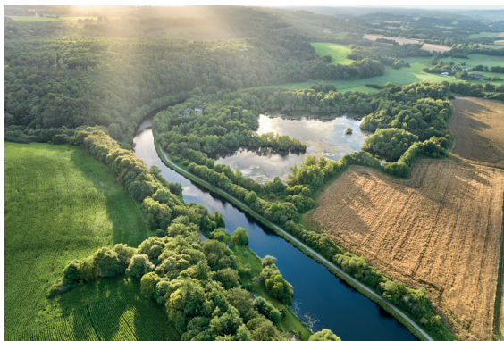
© Vue aérienne Blavet Crédit A.Lamouroux.