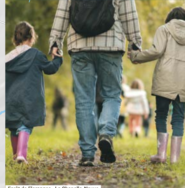
Forêt de Floranges - La Chapelle-Neuve