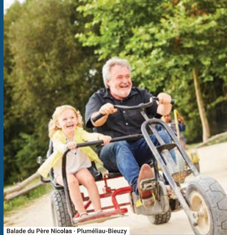
Balade du Père Nicolas - Pluméliau-Bieuzy