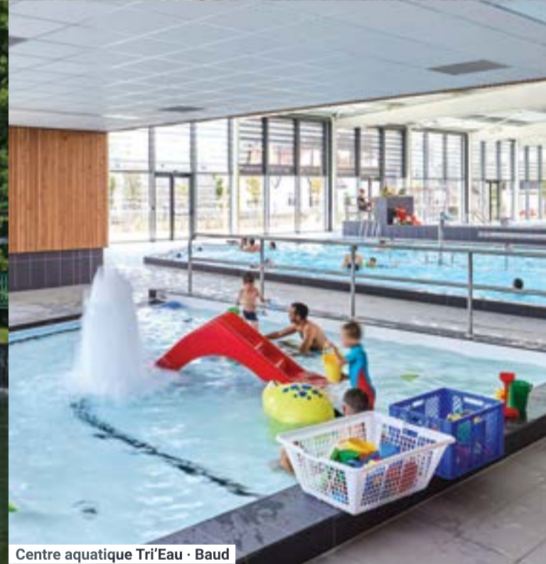
Centre aquatique Tri'Eau - Baud