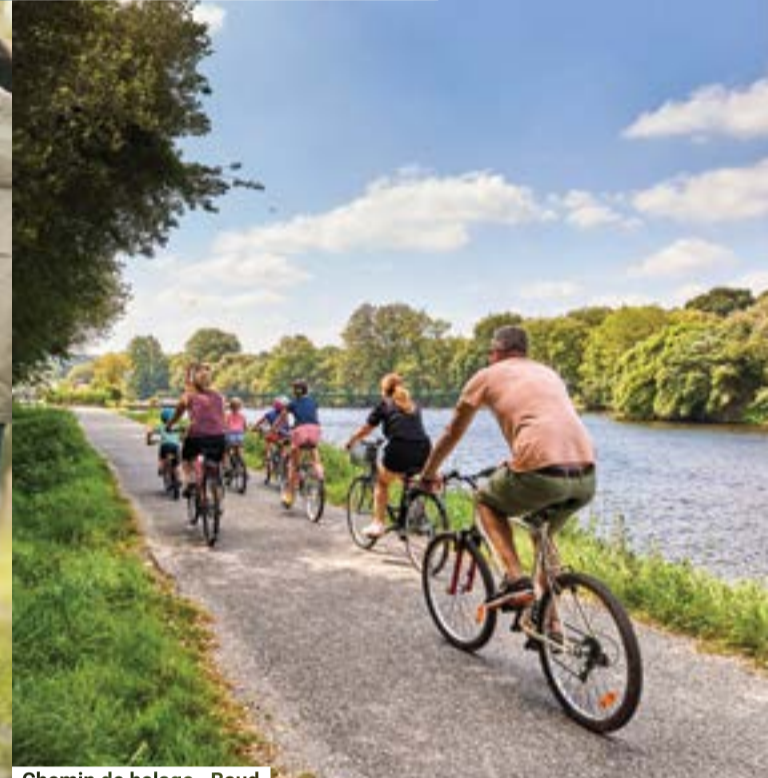
Chemin de halage - Baud