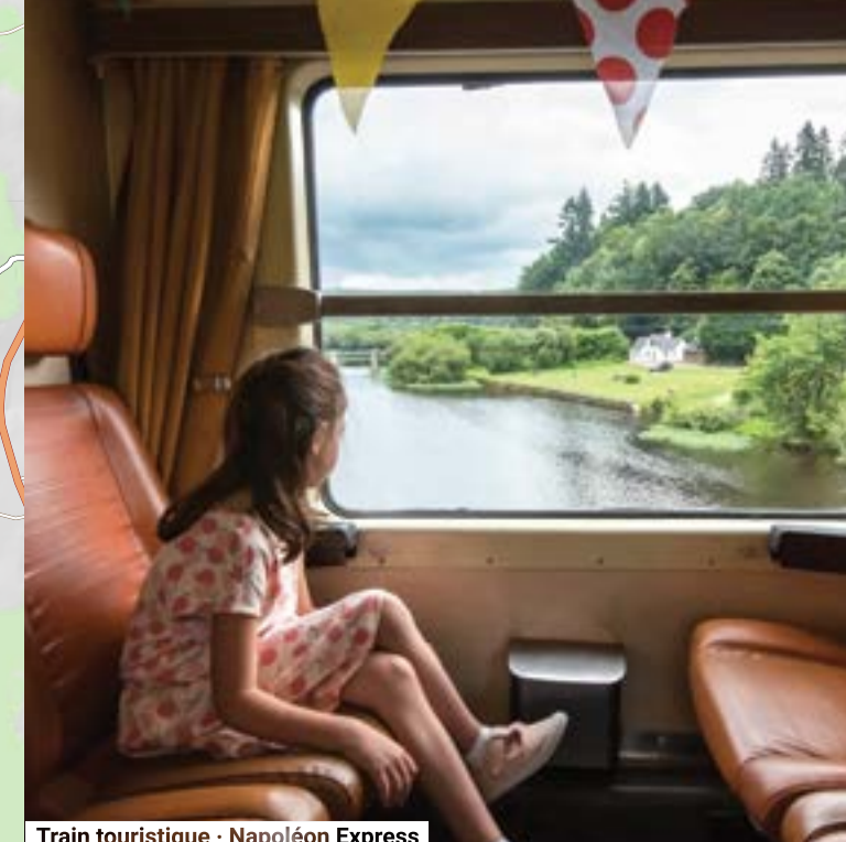
Train touristique - Napoléon Express