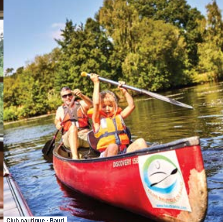
Club nautique - Baud