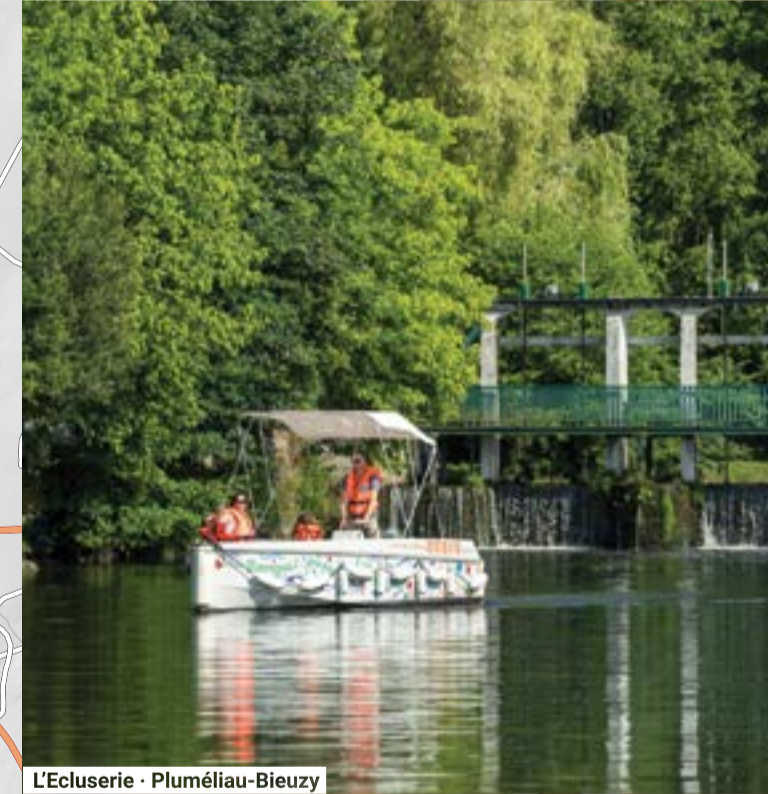
L'Ecluserie - Pluméliau-Bieuzy