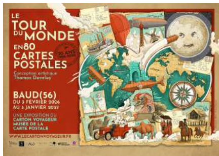
Musée de la carte postale | Ronan Pincemin

Infos 02 97 51 15 14 ; https://www.lecartonvoyageur.fr/