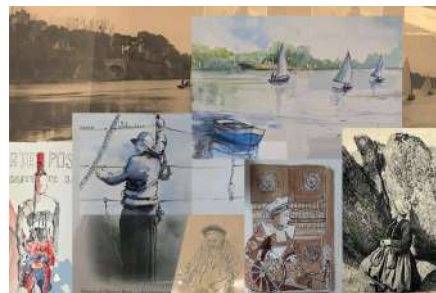
Illustrations F. Ledorze, D. Bruzac, A. Le Garrec montage C. Le Corre

Infos 02 97 51 15 14 ; https://www.lequatro.fr