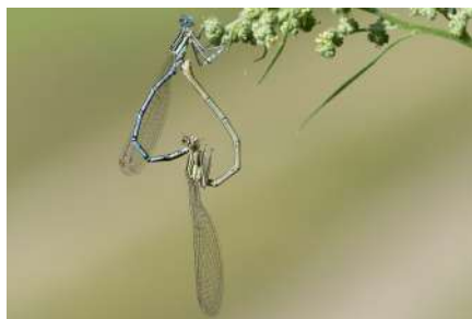
François Le Méec

Infos 02 97 07 82 20 mediatheque@plumeliau-bieuzy.bzh ;