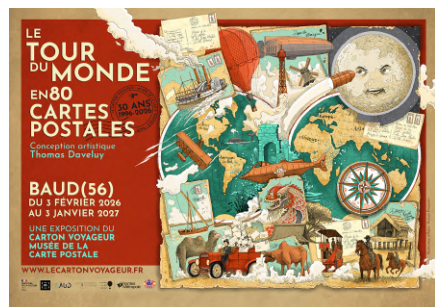
Musée de la carte postale | Ronan Pincemin

Infos 02 97 51 15 14 ; https://www.lecartonvoyageur.fr/