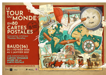
Le Carton Voyageur

Infos 02 97 07 82 20 mediatheque@plumelieu-bieuzy.bzh ;