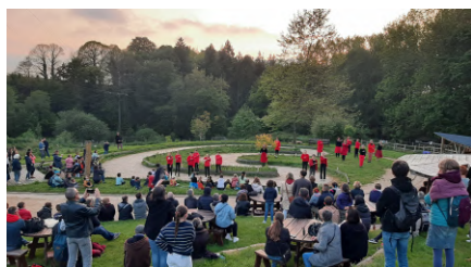
La Maison des Arts

Infos 02 97 51 13 19 ; https://www.lequatro.fr