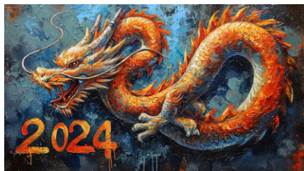
Vilius Kukanauskas_libre de droit