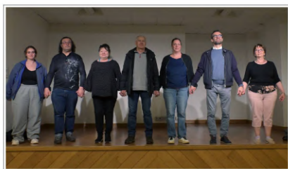
D.R. Melrand Arts Vivants

Infos 02 97 27 14 65 ; culture56150@gmail.com